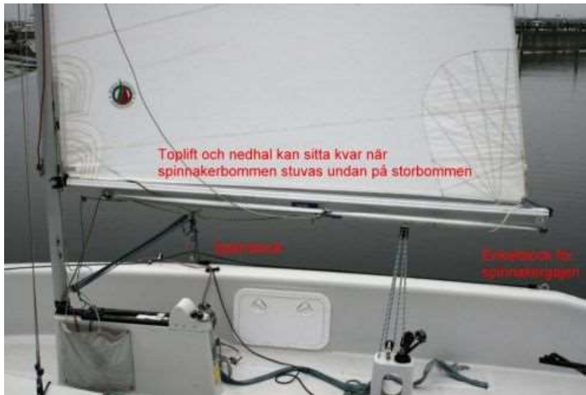
STUVNING AV SPINNAKERBOM