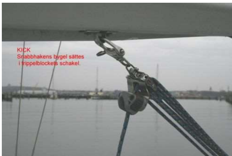
KICKENS FÄSTE I BOMMEN