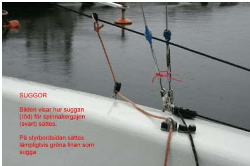
HUR SUGGOR SÄTTES